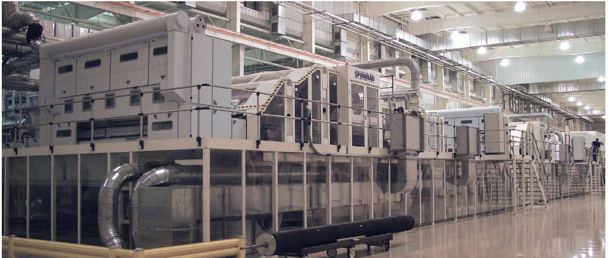
Hochgeschwindigkeits-Krempellinie für wasserstrahlverfestigte Produkte

Für die Dilo-Gruppe mit einem traditionell hohen Geschäftsanteil in China hat sich diese Erholung seit Mitte des Jahres spürbar gezeigt, so dass sich die Geschäftsaussichten insgesamt für den Nonwovens-Sektor wieder deutlich verbessert haben.