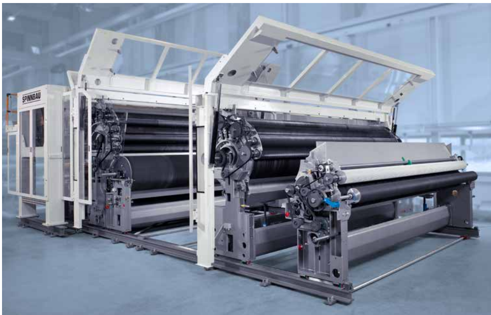
Hochgeschwindigkeitskrempel, Arbeitsbreite 5,1 m

Natürlich musste sich eine derartige medizinische Krise auch auf den Bedarf von Nonwovens für Medizin- und Hygieneprodukte positiv auswirken, so dass unser Auftragseingang stark geprägt ist von Maschinensystemen für Faservorbereitung und Vliesbildung wasserstrahlverfestigter Produkte. Hier hat die Dilo-Gruppe eine traditionelle Domäne bei großen Krempelarbeitsbreiten und hohen Florgeschwindigkeiten. In Asien besteht eine größere Nachfrage nach höherer Querfestigkeit dieser Produktart, die sowohl über die klassische Wirrvlies-Krempeltechnik als auch, noch besser, durch Kombinationen der Anlagen mit Hochgeschwindigkeits-Querlegern erfüllt werden kann.