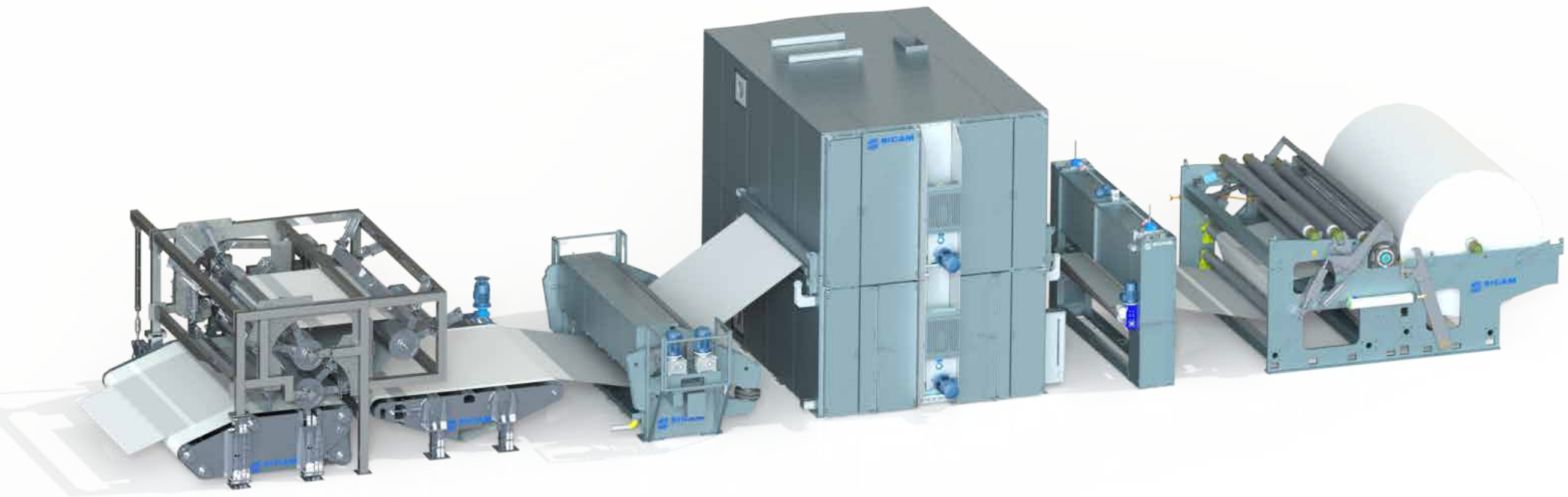
Wasserstrahlverfestigungseinheit mit end-of-line-System